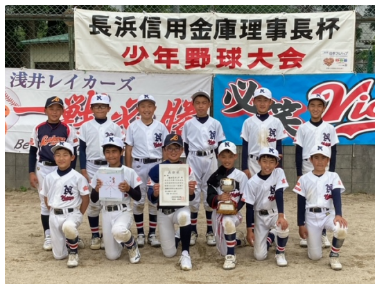
◀ 第28回優勝チーム 浅井長浜LV